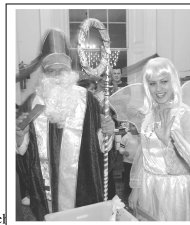
Mikulášská na Velehradě 5.12.2010

Na počátku každého roku se hádá, jaký že to asi bude rok a co všechno přinese a dělají se různá předsevzetí. Co se týče věštění z křišťálové koule, nedá se říci, že by bylo spolehlivé a tak nezbyvá než se spolehnout na odhady. Jedenáctka na konci letopočtu nepřinesla údajně nic významného v dějinách a to ani když se třeba podíváme postupně až o tisícovku let nazpět. A podobně je tomu i s padesátiletým kulatým výročím, snad kromě Gagarinova vesmírného letu v roce 1961. To však neznamená, že ten začínající rok by se nemohl stát něčím významným, třeba právě poprvé v dějinách. Třeba nějakým převratným objevem či vynálezem, nebo mírovou dohodou na Blízkém východě. Uvidíme tedy – možná přinese něco nového v rodinách a u přátel a známých a pro ně to pak bude opravdu významný rok.