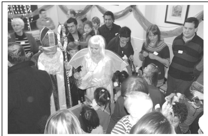
Mikulášská 2010 na Velehradě: Přišel sv. Mikuláš a radost dětí nebrala konce, dospělí se bavili a Velehrad praskal ve švech. Záběry z rozdávání dáreků ...