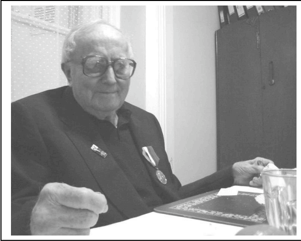
Prezident Václav Havel s Otcem Langem v roce 1990 během návštěvy Londýna, kdy zavítal i na slavnostní bohoslužbu v jezuitském kostele na Farm St., kde se náš exil tradičně celá desetiletí scházel a Otec Lang po obdržení Řádu TGM od prezidenta Havla v roce 1991