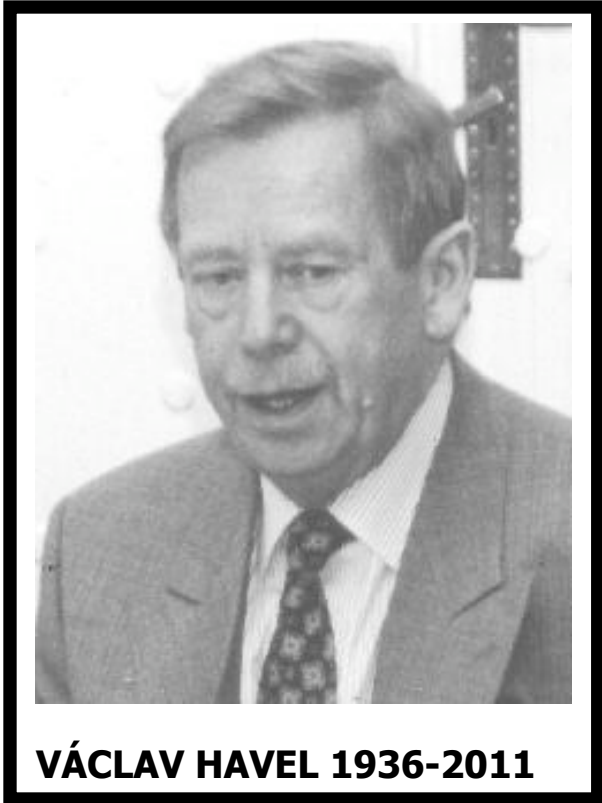
VÁCLAV HAVEL 1936-2011