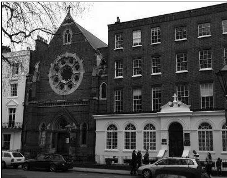
Kaple Maria Assumpta a Heythrop College a dole „nový Velehrad“