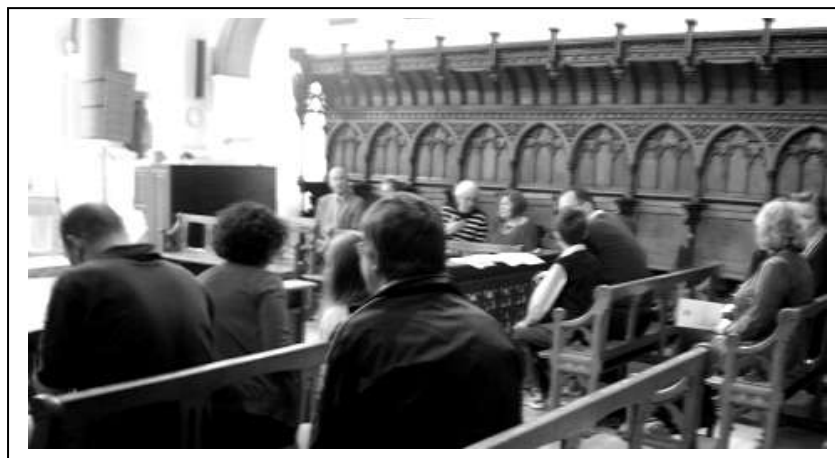
Otec Tomáš při promluvě během krajské bohoslužby v naší dočasné kapli na Kensington Square a pohled mezi farníky...