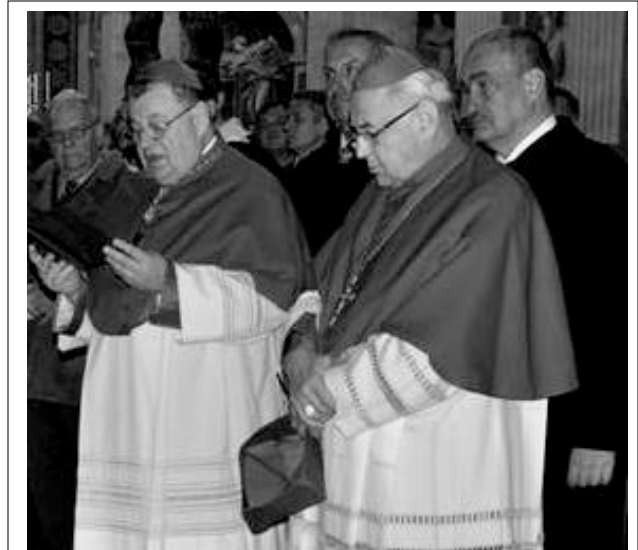
Dva čeští kardinálové Duka a Vlk ve svatopetrské bazilice po předání kardinálské hodnosti Dukovi Benediktem XVI. Za nimi stojí ministr zahraničí Schwarzenberg a český velvyslanec ve Vatikánu Vošalík.