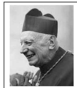
Tomáš kardinál Špidlík SJ 17.12 1919 – 16.4. 2010

Mnozí z nás si na tuto událost vzpomněli před dvěma týdny, když agentury oznámily, že ve věku devadesáti let Otec Špidlík 16.dubna zemřel -- ve Vatikánu a v hodnosti kardinála. Do té jej za zásluhy o církve po 38ti letech vedení Nepomucena a po vypracování se do role známého experta Gregoriánské univerzity na ekumenismus a východní církve a založení Alettiho Centra při Papežském orientálním institutu, povýšil papež Jan Pavel II. A dokonce mu prominul biskupské svěcení. V roli papežského rádce jej Otec Špidlík zjevně ovlivnil před publikací encykliky „Ut Unum Sint“ a zapůsobila určitě i jeho hluboká spiritualita, které dal vyniknout, když vedl duchovní cvičení pro papeže i kardinály. O tom, za jak významného a zasloužilého pro církve jej považoval i nynější papež Benedikt XVI. svědčila i skutečnost, že sám zaslal hlavě Jesuitů kondolenční telegram a osobně vedl 20.dubna pohřební ceremonie. Slavný rodák z Boskovic, který byl americkým Bibliografickým institutem jmenován „Mužem roku 1990“, o rok později „Nejobdivovanějším mužem desetiletí“ a v roce 1998 byl poctěn prezidentem Havlem Řádem TGM, pak nakrátko spočinul v papežské kryptě a byl převezen k pohřbu na moravský Velehrad. >>>>>