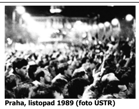
Praha, listopad 1989

S tím, jak se blíží ono významné výročí zhroucení sovětské komunistické říše -- a nikoli tedy jen „ukončení Studené války“ či „pád Berlínské zdi“, jak se světu snaží namluvit některé elementy západní levice -- se také objevují nejrůznější hodnocení tehdejších událostí u nás i v dalších moskevských koloniích či vazalských státech. To však je dnes lépe ponechat historikům, neboť to, co mnozí z nás pamatují, nám nikdo nevezme a co se tehdy stalo, kdo to způsobil a kdo podpořil Občanské hnutí a VPN, kdo byl proti a tak dále, budou oni jistě i nadále pilně studovat. Mnozí, kteří patřili k aktérům tehdejších událostí už ale nežijí a mnozí, kterým je řekneme méně než třicet si nepamatují nejen na ně, ale i ani na režim, jehož pád my o trochu starší s takovou radostí stále oslavujeme. Všichni se však můžeme společně ohlédnout na oněch uplynulých dvacet let a pokusit se analyzovat jejich klady i zápory. Je to ostatně stejně dlouhá doba, jakou trvala naše první republika, na kterou si dnes už pamatují jen ti nejstarší z nás, přitom však oni pamětníci i experti shodně konstatují, že to byla dobrá a slavná doba naší státnosti, kdy se většinu plánů -- i když ne všechny -- docela dařilo uskutečňovat. Dá se to však dnes říci i o uplynulých dvaceti letech?