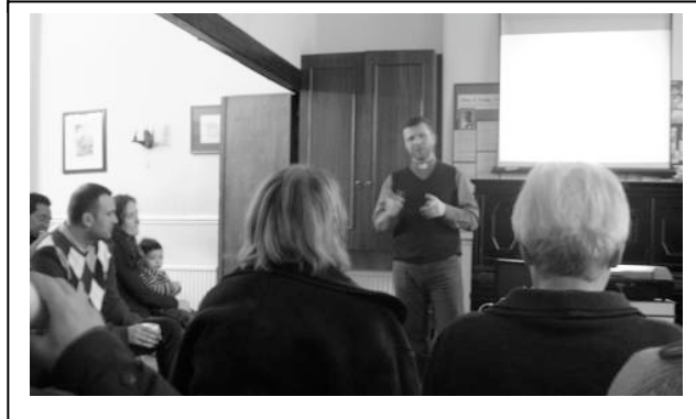
Z „Palachovské“ mše a přednáška O.Lukáše o psychologii dětí