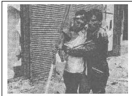
Okupace: Sto mrtvých, téměř 335 těžce a 590 lehce raněných (údaje Min. vnitra)

obchodů vítaly miliony plakátů s nápisy „Jděte domů!“, „Co tu děláte?“, „Okupanti!“ a podobně. Obyvatelstvo se těšilo podpoře médií, včetně rozhlasu a televize, která dokonce začala vysílat barevně ze studií k tomu účelu připravených a jako antény rozhlasu prý posloužily vypnuté troleje tramvají. U rozhlasu na Vinohradské třídě vyrostly barikády z autobusů, které měly zabránit jeho okupování a rozlehly výbuchy munice a střelba, stejně jako u Národního muzea, které prý si rudoarmějci spletli s budovou vlády. Ostatně, fasáda je následky střelby dodnes poznamenaná. Počet mrtvých dosáhl brzy šedesátky. Podobně či jinak prožívali okupaci i jinde v Čechách a na Slovensku. Vedení země bylo pochyťáno odvezeno do Moskvy podepsat kapitulaci, reformní komunisté ještě uspořádali tajný sjezd a odsoudili okupaci i kolaboranty, ale to vše už mnoho nezměnilo. Pár stovek tisíc lidí emigrovalo, vojska byla brzy stažena na stálé