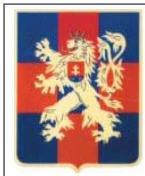
Znaky čs. stíhacích perutí 134. Wingu a Čs. obrněné brigád